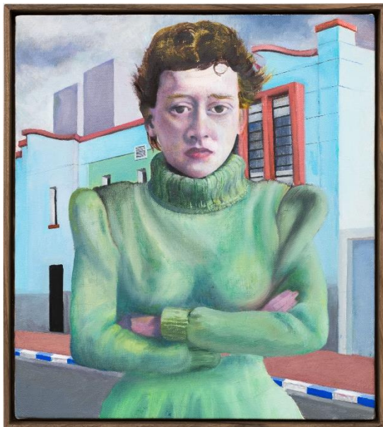
Katharina Wulff, Frieda, 2023, Öl auf Leinwand, 44 x 38,4 cm