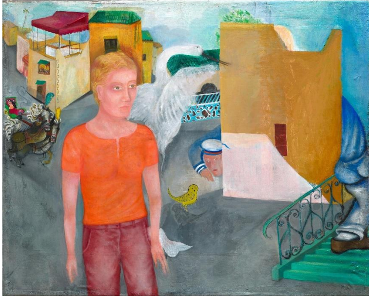
Katharina Wulff, Der Aufbruch, 2012, Öl auf Leinwand, 65 × 52 cm, Courtesy die Künstlerin und Greene Naftali, New York