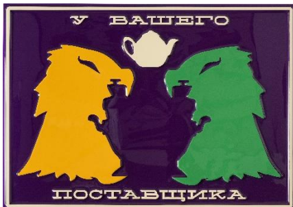
Slavs and Tatars, This not that, 2024, vacuum-formed plastic, acrylic paint, 71x100 cm