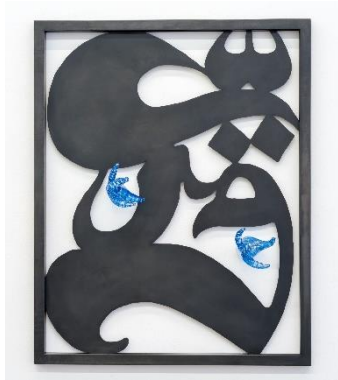
Astaneh, Persian, 2024, steel, glass, 105x75x18 cm