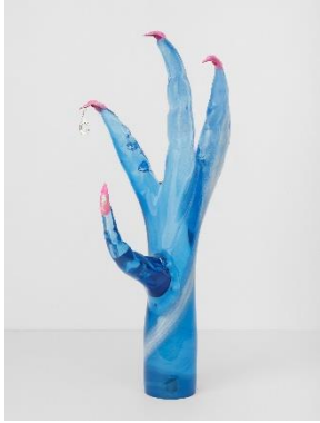
Slavs and Tatars, Stiletto 'C', 2024, hand-blown glass, hand-made faux nails, 60x30x25 cm